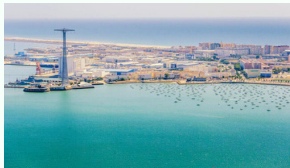
La Estrategia de Desarrollo Urbano y Sostenible EDUSI Cádiz favorecerá la integración entre los propios barrios y de éstos con el resto de la ciudad y de la Bahía.

2. Proceso participativo que se llevó a cabo de forma directa a través de talleres sectoriales y transversales en los que participaron más de ochenta entidades y que permitió conocer la realidad socioeconómica de la ciudad trasladando la percepción de la ciudadanía y profesionales sobre los retos económicos, ambientales, climáticos, demográficos y sociales a los que la ciudad se enfrenta en la próxima década.