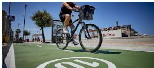
EDUSI Cádiz contribuye al fomento de la movilidad urbana sostenible en apoyo a la transición a una Economía baja en carbono.

¡¡¡Visita la web y hazte partícipe de ella!!!