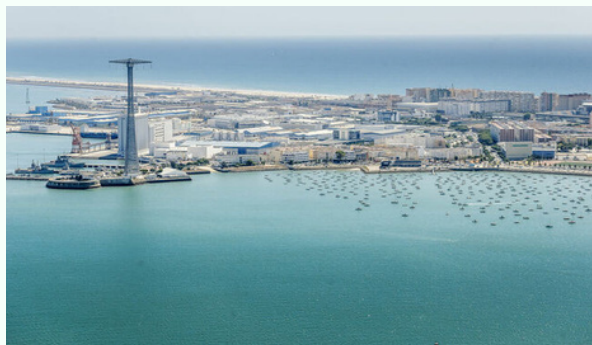
La Estrategia de Desarrollo Urbano y Sostenible DUSI Cádiz favorecerá la integración entre los propios barrios y de éstos con el resto de la ciudad y de la Bahía.

Con un ámbito de actuación en los Barrios de Segunda Aguada, Guillen Moreno, Barriada de la Paz, Cerro del Moro, Loreto y Puntales nace con la visión estratégica de “conseguir que la zona sea en un futuro un lugar de regeneración medioambiental sostenible, con nuevos espacios de innovación económica, social y cultural ubicados en edificios históricos en los que se difunda el conocimiento y se creen empresas, con condiciones de vida dignas para todos, sin pobreza, exclusión social, ni discriminación, y con cambios demográficos y de accesibilidad favorables”.